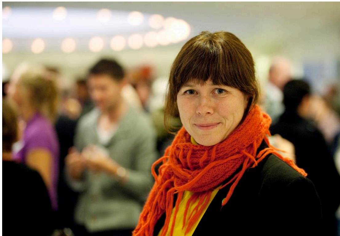
Åsa Romson, Språkrör Miljöpartiet de gröna